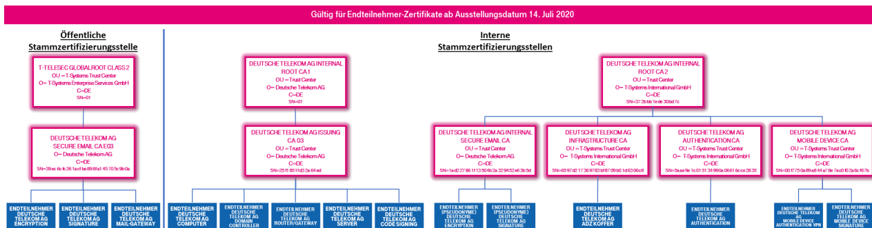
Abbildung 1: Übersicht des Root- und Sub-CAs ab Zertifikatsausstellungsdatum 14.07.2020

In Abbildung 1 ist die aktuell gültige Übersicht des PKI-Service „cPKI“ mit den Root- und Sub-CAs, aus denen Zertifikate ab Zertifikatsausstellungsdatum 14.07.2020 ausgestellt werden, grafisch dargestellt.